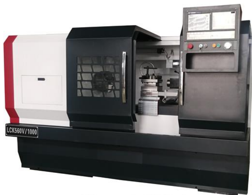
Фото внешнего вида всей машины (фото для справки)