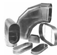
Плоско-овальные фасонные изделия