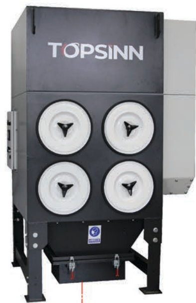
Фильтрационная установка (ПРОДАЁТСЯ ОТДЕЛЬНО)